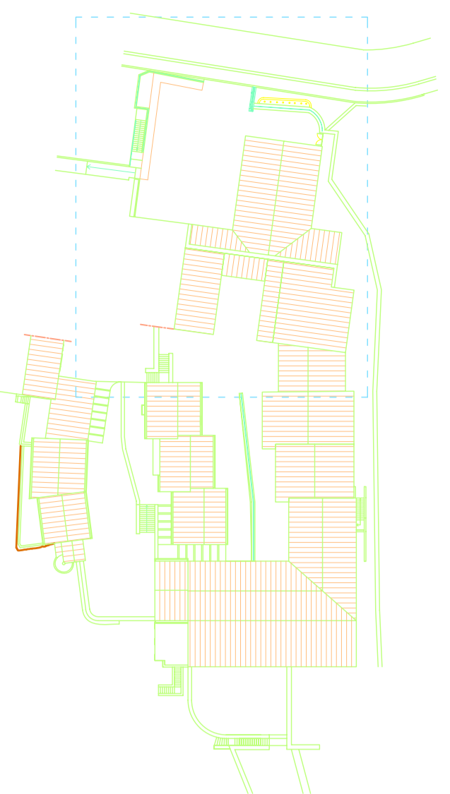
PIANTA GENERALE DI RIFERIMENTO

NOTA ERNE - I codici numerici evidenziati si riferiscono alle voci di elenco prezzi del progetto - I tracciati delle canalizzazioni sono indicativi, prima della loro definizione operativa e necessario verificare lungo il percorso eventuali conflitti con realtà impiantistiche esistenti